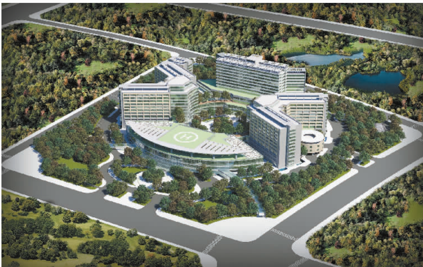
圣德国际医院规划效果图

圣德医院建设遵循“以人为本”的原则;统一规划,分期实施,充分体现可持续发展的经营理念。重点打造“人性化服务,数字化医院,生态化环境,创新化科技”的现代医院的品质。建成之后必将成为河南省设施一流、技术先进、环境优美、充满人性关怀的大型现代化花园式综合医院。