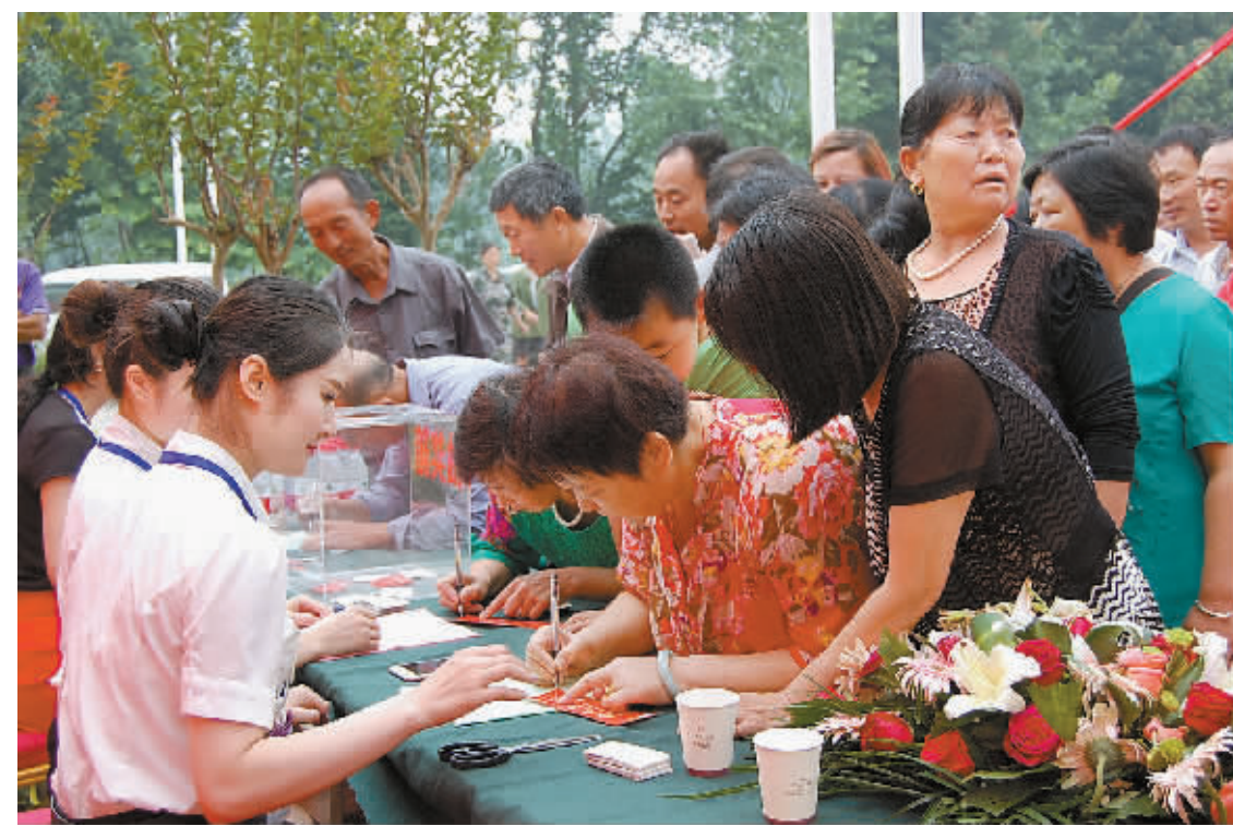
近年来,光山县科学规划城市,不断改善城市居民居住环境,完善城市功能,提高绿化占比,融生态、文化、景观为一体,致力打造美丽文明和谐幸福社区。图为昨天一新建小区居民办理住房相关手续。

本报讯(记者 时秀敏)记者昨日从市文明办获悉,经中央文明委审定,从6月23日起,对327名第五届全国道德模范候选人进行全国公示。其中,助人为乐类71名、见义勇为类63名、诚实守信类63名、敬业奉献类71名、孝老爱亲类59名。我市推荐的候选人许光和胡阳海、黄春刚分别入选敬业奉献类和见义勇为类候选人。 419号候选人许光生前系河南省新县人大常委会退休干部,曾荣获河南省道德模范荣誉称号。他是开国上将许世友长子、《闪闪的红星》主人公潘冬子的主要原型。青年时期在北海舰队服役,是我军首批具有本科学历的舰艇长。1965年投身家乡建设,奉献48个春秋。他身为将门之后,甘为布衣,甘愿无名,为改变家乡面貌殚精竭虑,与人民群众血脉相连,继承和发扬了共产党人的红色基因。他多次放弃回部队提拔或调到城市工作的机会,坚决扎根新县。他为人光明磊落,淡泊名利,从不以将军后代自居,从不为子女亲属托人情。他一生艰苦朴素,直到去世还用着上世纪70年代的大立柜、80年代的沙发、90年代的老式电视。身患癌症后,为节约费用,坚决拒绝治疗。一生清贫的他,却资助了老红军10多万元,临终前还将20万元积蓄全部捐赠给家乡的慈善事业。 246号候选人胡阳海、黄春刚是我市潢川县谈店乡农民。2014年9月3日晚8时许,正在青岛市为一家店铺进行装修的胡阳海、黄春刚,突然听见女店主大喊:“抢劫快抓住他!”两人立即扔下手中活计追了上去。他们连追4个路口,与歹徒展开生死搏斗,身负重伤,最终将歹徒制服。胡阳海胸、腹各中一刀,腹部刺伤长达25厘米,肝脏刺伤4厘米,一条动脉断裂,肠子破漏露在体外。经过抢救,胡阳海腹部缝了21针,因腹腔严重感染,缝合后的肠子在体外用红袋覆盖,直到2015年1月,才实施二次手术放回。面对生死考验,胡阳海和黄春刚说:“再来一次,还会冲上去!”胡阳海、黄春刚荣获河南省见义勇为好青年称号、山东省见义勇为模范,荣登“中国好人榜”。 另据了解,6月24日至7月22日,主办单位将在人民日报、解放军报、中国文明网、人民网、新华网等20家媒体和网站同步刊登候选人事迹;同时在中央人民广播电台、中央电视台进行滚动展播。