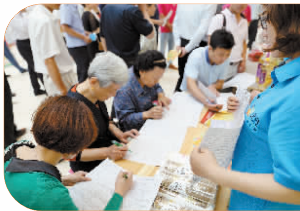
填写食品安全知识问卷。