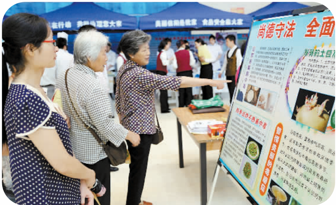
观看食品安全知识展板。

全国食品安全宣传周活动的主题是“尚德守法,全面提升食品安全法治化水平”。本次宣传周活动从6月16日至7月2日。食品安全宣传周期间,浉河区、平桥区将共同组织浉河区政府食品安全委员会成员单位、平桥区政府食品安全委员会成员单位及相关部门、食品企业、食品行业协会等60家单位开展一系列进店铺、进企业等主题宣传活动。