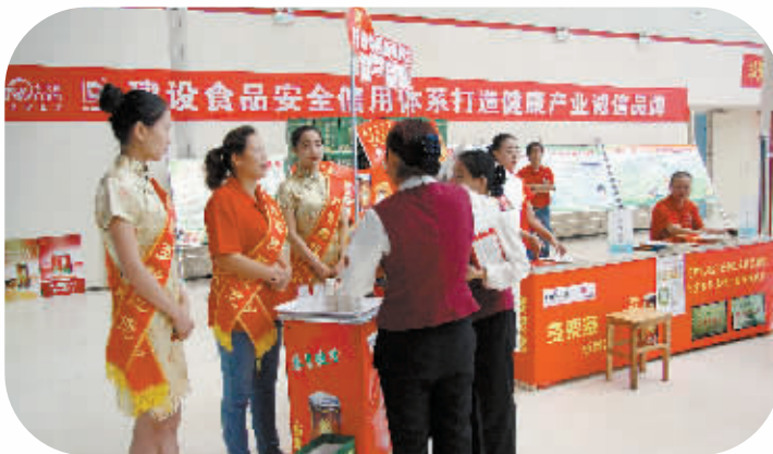
品尝多果多板果汁。