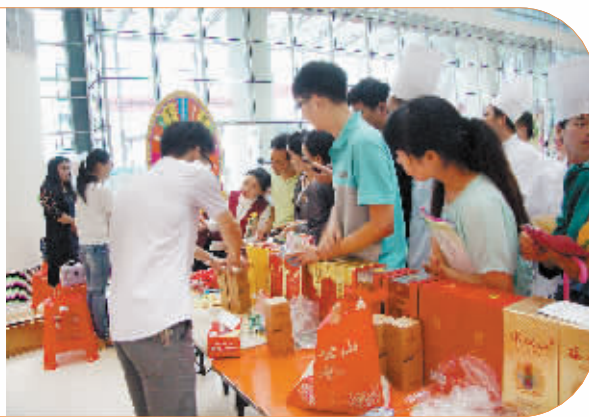
参加鸡公山酒业抽奖活动。