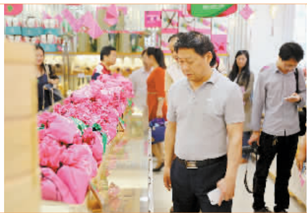
参观红房子蛋糕房。