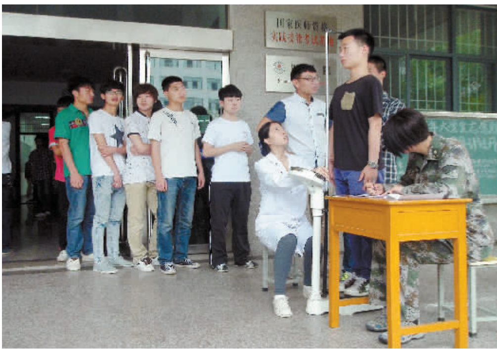
日前,平桥区人武部组织80余名报名应征大学生在市第四人民医院进行体检。这次参加体检的大学生,是从前期报名的100多名符合应征条件的大学生中筛选而出的。图为应征大学生测量身高的场景。