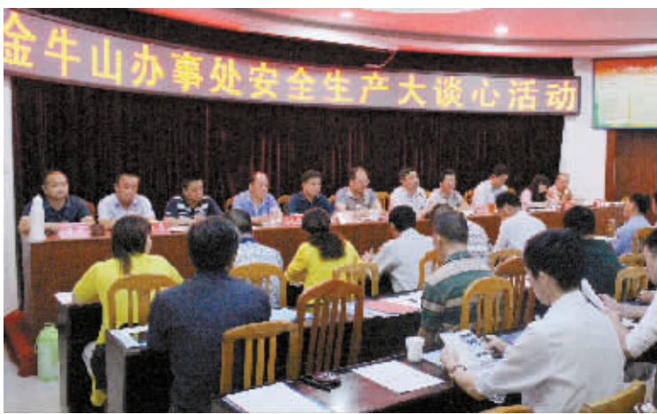
金牛山办事处开展安全生产谈心活动的场景。

本报讯(金亮 雪萍 新军)近期,浉河区金牛山办事处认真贯彻中央和省、市、区有关安全生产的指示精神,精心组织,强化措施,明确分工,加强安全生产工作,保障辖区居民生命财产安全,并开展安全生产对话谈心活动。 日前,办事处召开21个社区、垂直单位和企业的主要负责人参加的辖区安全生产工作会,共同学习新《安全生产法》部分重要章节,深刻认识生产安全事故对群众生命安全的严重危害,深刻认识触碰安全生产“红线”的严重后果,采取坚决措施,有效防范和遏制事故发生,切实做到守土有责,确保一方平安。以集体谈和“一对一”相结合,强化责任人红线意识、依法履职尽责、防范遏制事故等话题进行沟通,拿出加强和改进的具体措施,要求谈心对象对履职尽责做出相应承诺并签订责任书,更加自觉地履职尽责和支持安全生产工作。办事处与辖区各单位负责人签订安全生产责任书,努力构建起“无缝隙、全覆盖”的安全网格。各相关部门、各社区按照工作职能各司其职,各