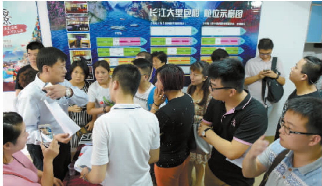
6月2日,在上海协和国际旅行社福州市鼓楼区分公司“长江客轮翻沉事件”家属临时安置点内,福建省旅游局工作人员(左)在向乘客家属通报相关情况。6月1日晚,从南京驶往重庆的客船“东方之星”轮在长江中游湖北监利水域发生翻沉,船上有福建籍游客19名。