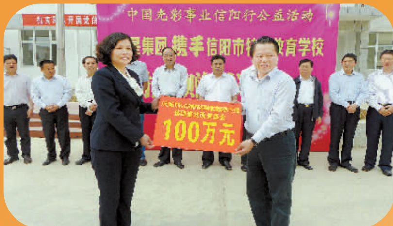
中国光彩事业信阳行——月星集团向市特殊教育学校捐赠100万元用于建设“月星康复中心”。