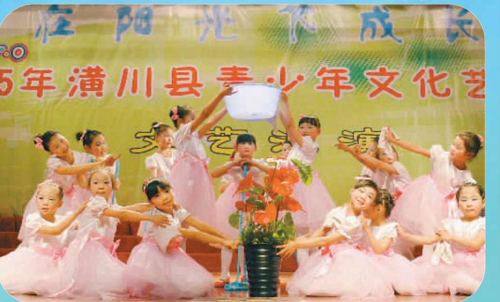
6月1日,2015年潢川县青少年文化艺术节文艺汇演在该县启明中学举行。此次活动由潢川县委宣传部、县文明办、团县委、关工委、教体局联合举办,涵盖了音乐、舞蹈、朗诵、器乐演奏、情景剧等节目,是2015年潢川县青少年艺术节系列活动之一。