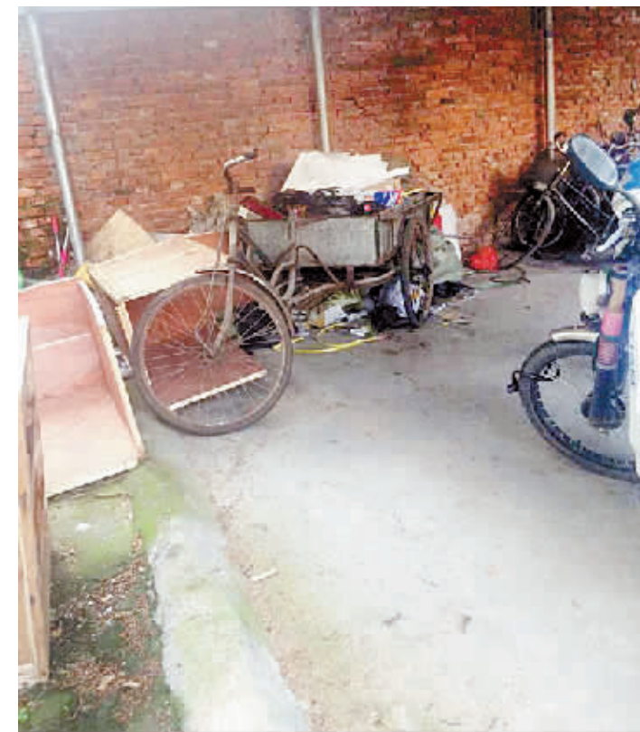
信阳市第三人民医院停车棚里车辆、杂物乱摆乱放。

现象。近日,记者走访了信阳市第三人民医院,发现了车辆乱停乱放、杂物乱摆乱放等一些急需改进的问题。从今日起,本报“健康新闻”版设立曝光台,对有损全国文明城市的不文明行为进行曝光,以促进我市全国文明城市的创建。