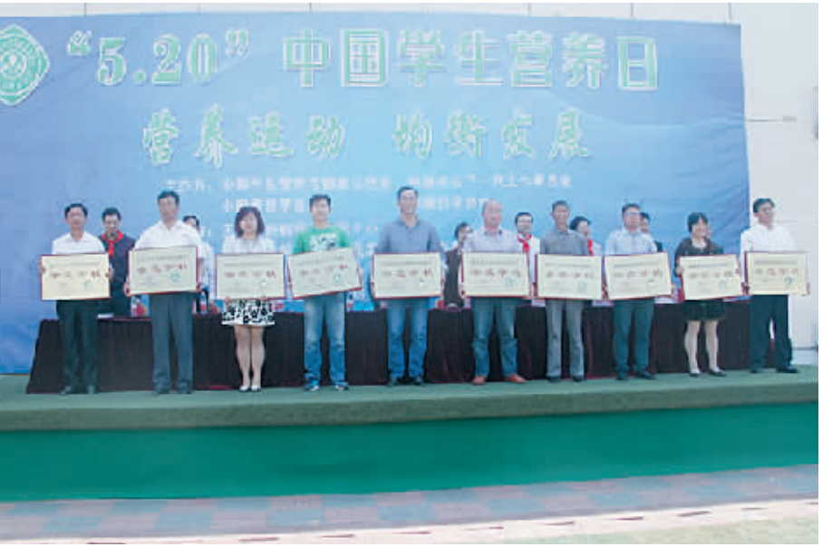
图为羊山外国语小学获奖场景。

目前,我市各县(区)数百所中小学校(幼儿园)的学生受益,学生、家长、社会普遍反响良好。