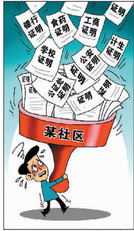
万能公章 新华社发 朱慧卿 作

西北大学社会事业发展研究中心主任雷晓康表示,目前要求社区居委会证明的内容五花八门、种类繁多,其中多是由相关部门向社区的转嫁职能,明显超出了社区居委会能够掌握的信息范围和所承担的职责。