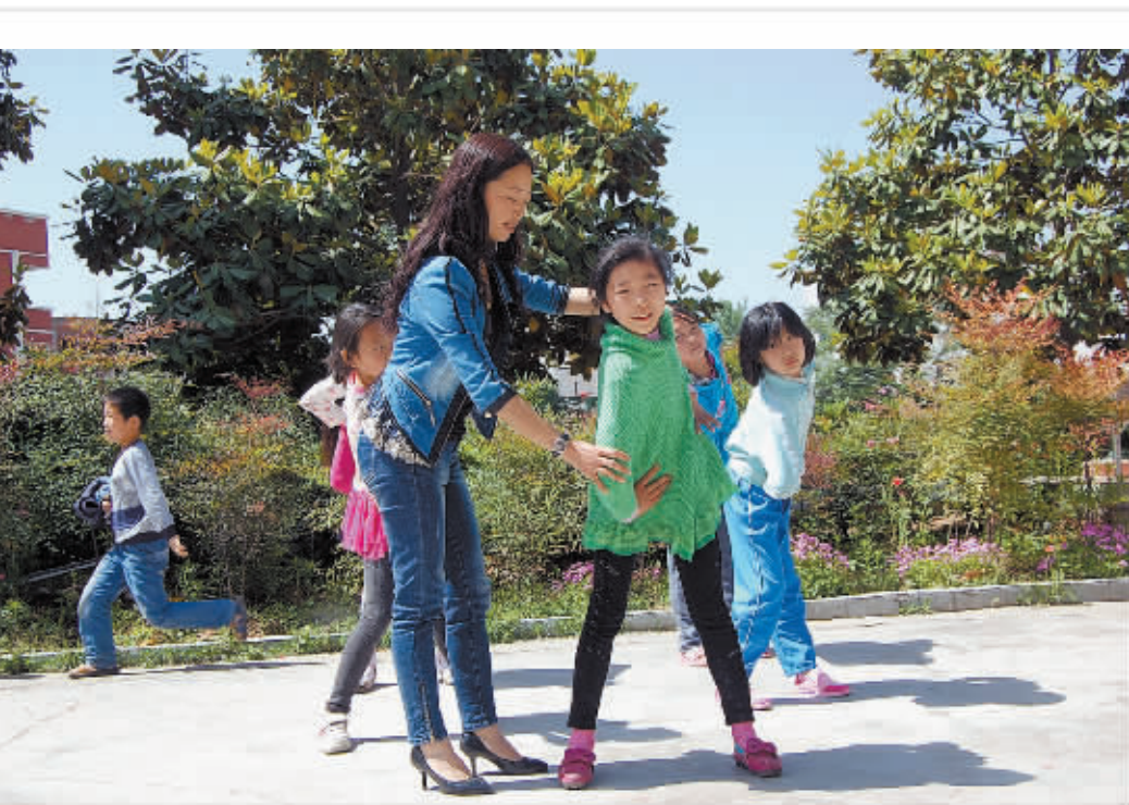
光山阳光中学注重教学研究,全面实行新课改。建校以来,该校共有500余人考取光山县二高本部,2000余人考取重点高中,升学率为98%,被中国民办教育联合会评为“全国先进民办学校”。该校对留守儿童、孤儿等学生减免学杂费,实行教师和学生同住、同吃、同学习制度。图为周末该校教师在和留守儿童一起学习舞蹈。