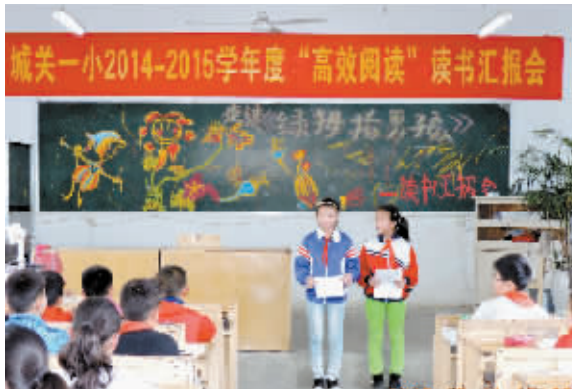
为了实现“高效阅读”的目标,近日,淮滨县城关一小举办读书汇报会。活动中,该校各年级组织了丰富多彩的展示课。