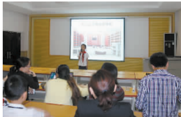
为营造浓厚的阅读氛围,提高学生的口语表达能力,近日,光山县第五完全小学举行了童话故事会。孩子们声情并茂地讲述了一个个精彩的童话故事。