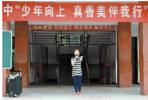
5月18日,市五中举行“少年向上,真善美伴我行”主题读书演讲比赛。20余位选手围绕活动主题,声情并茂地阐述了自己对真、善、美的理解。