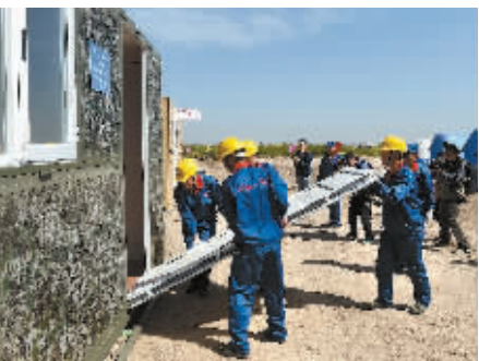
5月12日,演练人员在进行安置区搭建、空中灭火项目。

当日是第七个全国防灾减灾日,由河南省减灾委员会主办的河南省“5·12”防灾减灾应急演练综合演练在郑州市黄河游览区举行,包括安置区搭建、火场逃生、空中灭火、山体滑坡救援、水上救援等多个项目。