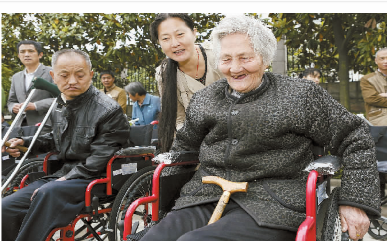
5月8日,新县举行“曙光行动”轮椅助行发放仪式。此次发放的轮椅由省助残济困基金会、省残疾人福利基金会捐赠。当天,该县共有55名残疾人领取轮椅。