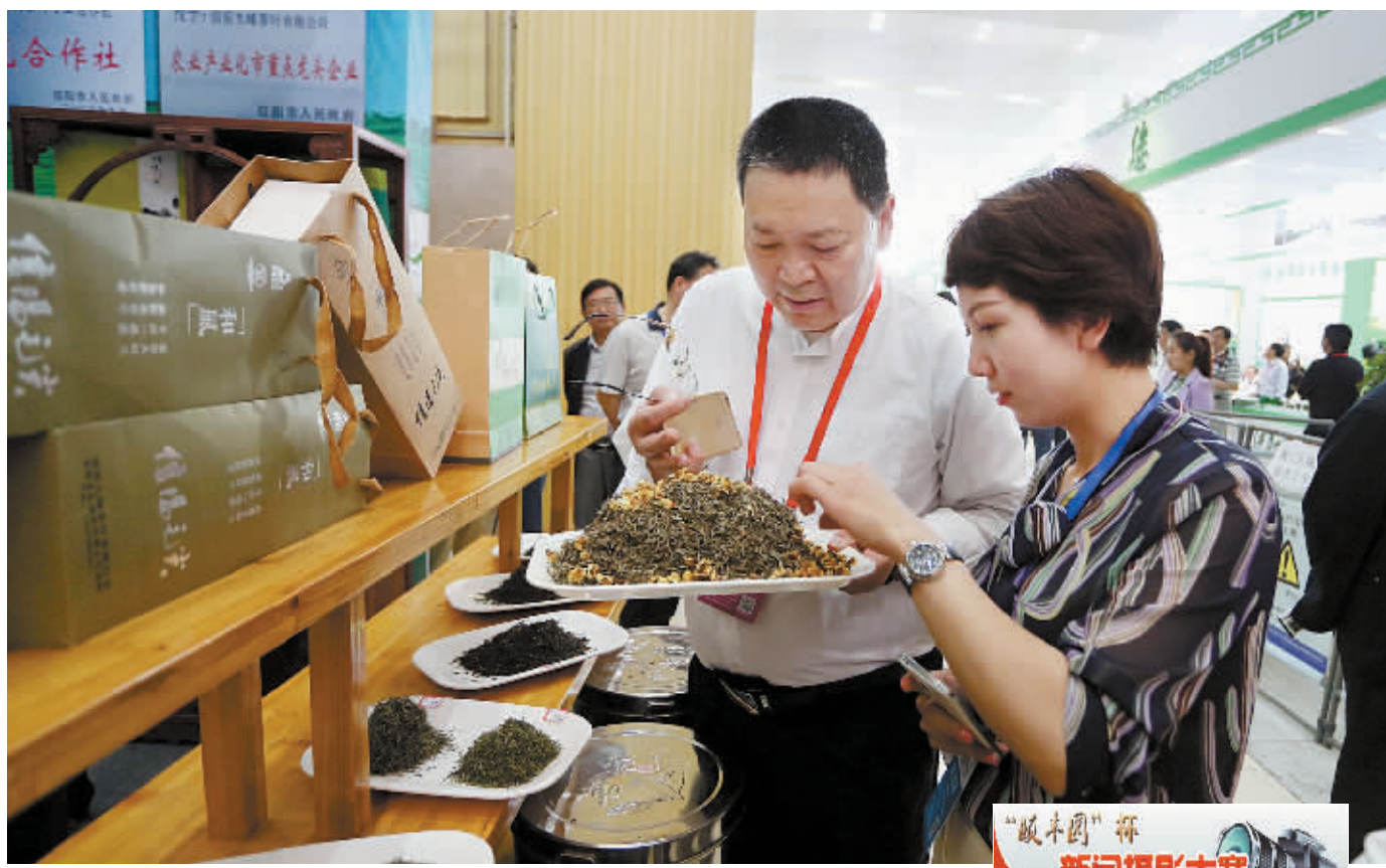
昨日,在2015中国(信阳)国际茶业博览会上,茶商促销各显神通,各种茶样直观品鉴让顾客流连忘返。

社会主义核心价值观 富强 民主 文明 和谐 自由 平等 公正 法治 爱国 敬业 诚信 友善