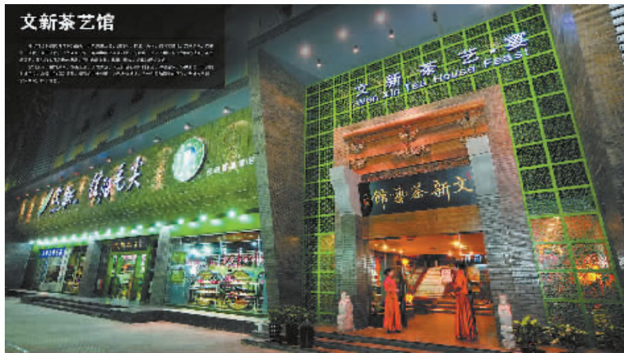
文新茶叶在北京、上海、武汉、郑州和香港等地开设了169家直营专卖店和茶艺馆,318家加盟店遍布全国各地。