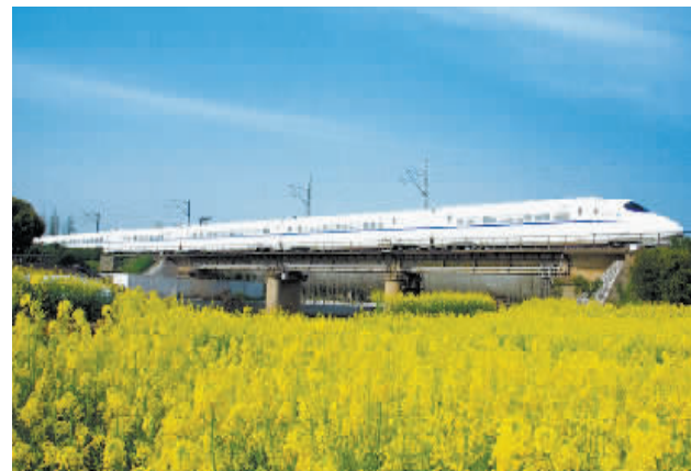
通达浉河 活力无限