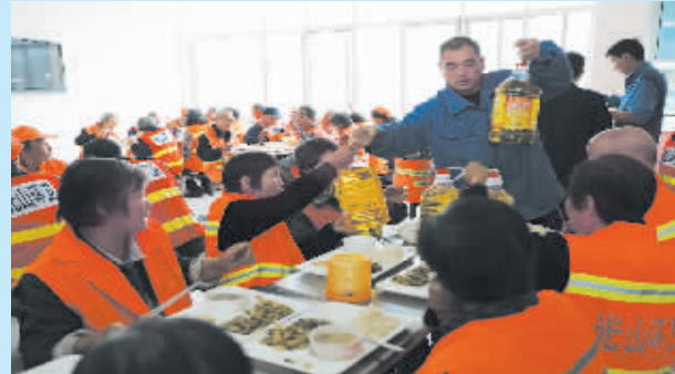
捐资修路、抗旱打井、慰问孤寡老人、贫困群众、环卫工人……公司每年都积极参与各种社会公益活动