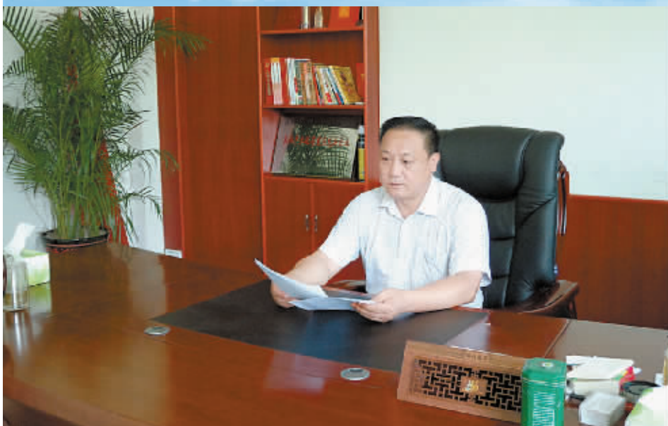
着一颗诚心,做好每一滴油

料产量百强县,大规模的订单农业和原料基地建设,为四方乐食用油的生产提供了优质的原料。