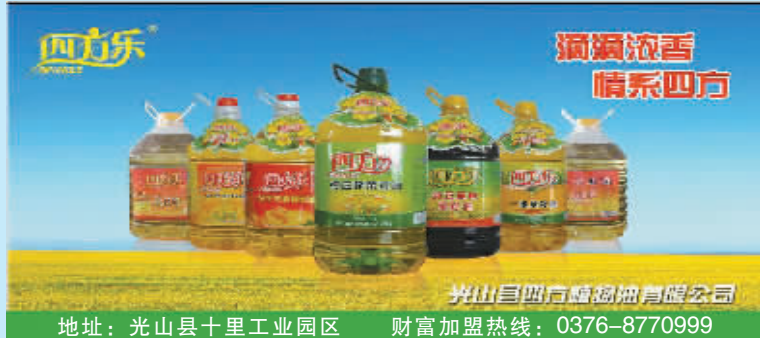
主要产品:菜籽油、花生油、大豆油、稻米油、山茶油