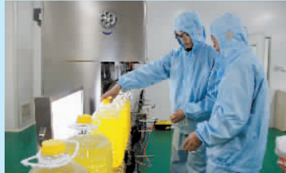
先进的检测技术,完整的产品质量安全体系,全面保证了产品不出任何质量问题