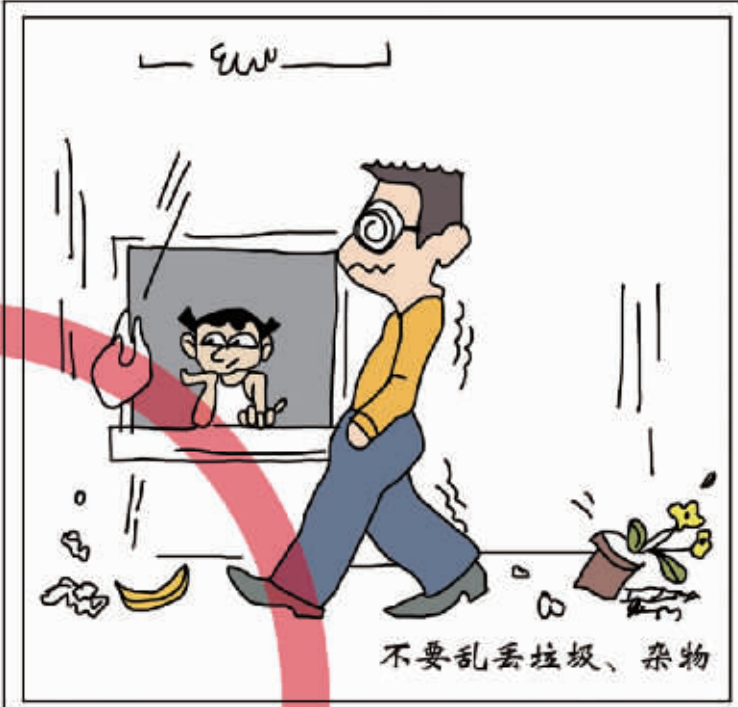
不要乱丢垃圾、杂物