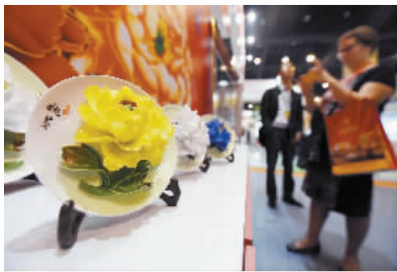
4月22日,客商、来宾们在投洽会展厅内参观。当日,第九届中国(河南)国际投资贸易洽谈会在郑州开幕,本届投洽会邀请到境内外参会客商1.7万多名。