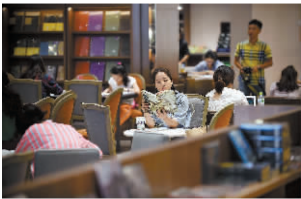
4月22日,读者在“知行行书局”里阅读。在被称为“最美书店”的海南省海口市“知行行书局”里,伴随着轻柔的音乐,读者手捧咖啡、香茗,静静品读纸质图书。