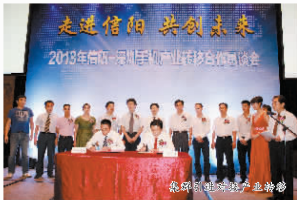
集群引进对接产业转移

好风凭借力,扬帆正当时。回眸过去,激情满怀,一系列大手笔在产业发展蓝图上落下浓墨重彩,一大批有实力、高水平的企业集团在信阳工业城这片投资热土竞相聚集。展望未来,踌躇满志,我们有理由相信,信阳工业城必将运势腾飞,迎来更加辉煌、灿烂的艳阳天。