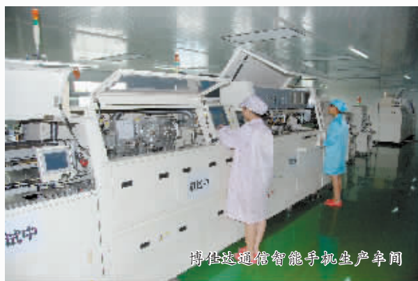
博仕达通信智能手机生产车间