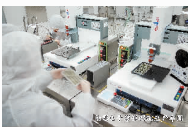
陆骢电子影像模组生产车间