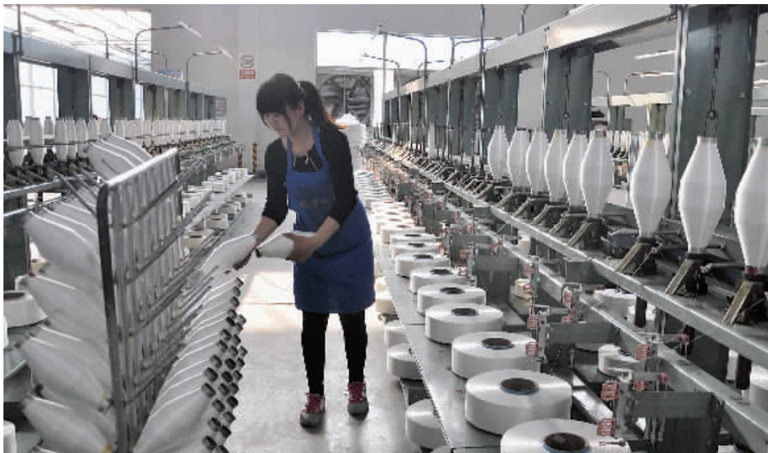
昨日,记者在淮滨县产业集聚区浙商纺织有限公司生产车间看到,工人们正在自动化生产线旁紧张地忙碌着。该公司是一家集化纤、织造、科研于一体的大型化纤纺织企业,产品远销东南亚及国内主要纺织市场,有效促进了当地经济发展。

为社会发展的趋向,环保已经成为人们追求的目标。我们应转变观念,摒弃陋习,移风易俗,与时俱进,使清明祭扫先人寄托哀思的传统习俗成为一种积极向上的民族文化,应该提倡隆重、俭朴,这种感情不需要形式上的铺张浪费来表达,像开展网络祭扫、家庭追思、社区公祭等活动,倡导通过鲜花、赋诗、信函、音像等文明、环保、安全的祭扫形式,表达对先人的缅怀和敬仰,不仅可以寄托我们的哀思,还可以收获环境之“清”,心灵之“明”。这是人们意识更新、社会进步的标志,应当大力提倡并成为一种习惯。