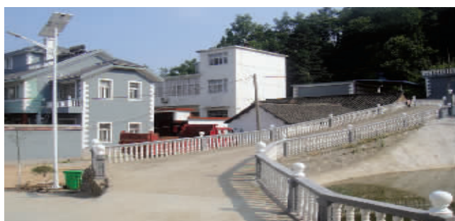
今年,商城县在建设美丽乡村工作中,全力打造交通沿线、旅游景区、连线节点村,着力推进五大美丽乡村示范点建设,实现全县农村人居环境治理全覆盖。图为该县鲇鱼山乡土门村美丽乡村一角。

□本报记者 时秀敏 郝光 吴楠 见习记者 黄宁 烈士资料:温世荣,男,1935年4月出生于信阳市息县张陶乡赵楼村。1956年3月参加革命,1958年8月病故于锦州,9808部队战士。(资料来源于河南省英烈网)现安葬于辽宁省解放锦州烈士陵园。 油菜花开满地金,杜鹃声里又春深。3月25日,循着飘香的油菜花,记者来到了抗美援朝烈士温世荣的家乡——息县张陶乡赵楼