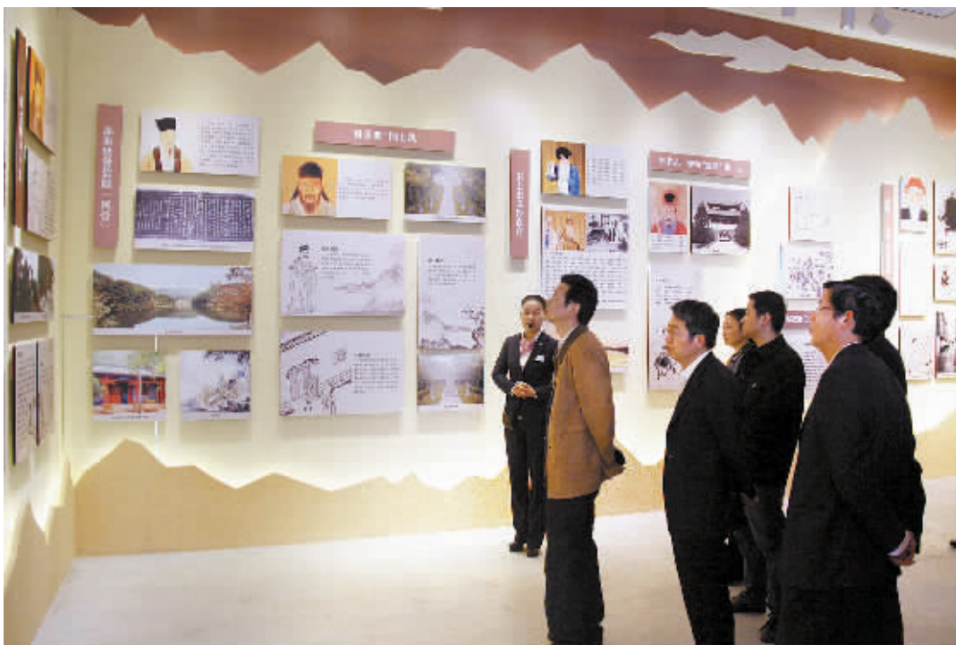
日前,市行政服务中心组织机关干部职工和窗口工作人员到大别山红廉文化苑参观学习,重温了大别山精神,强化了为民服务的宗旨。

等业务知识课程。同时,举办基层党组织书记论坛,邀请担任43年村党组织书记的邱树堂,结合自己的工作经历,分别就村党组织书记工作职责、能力素质以及如何联系服务群众等,为全县227名村(社区)党组织第一书记、书记上了生动的一课。 灵活培训方式。培训采用课堂教学、现场教学、访谈式教学、情景教学等方式,激发了村(社区)党组织第一书记、书记们的学习热情,增强了培训的效果。坚持“请进来”与“走出去”相结合,分别邀请解放军总参宣传部研究员王立华、邓州市委组织部副部长张有印等前来授课,还组织村(社区)党组织第一书记、书记到湖北红安李先念故居纪念馆、七里坪长征胜利旧址、光山县委王湾会议旧址参观学习。通过培训,村(社区)党组织第一书记、书记心灵受到震撼,情操得到陶冶,党性得到增强,综合素质和业务能力得到提高。