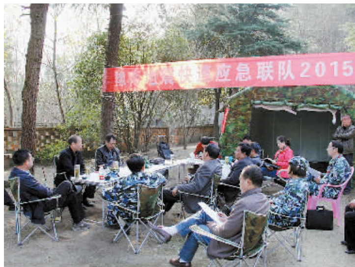
3月25日,2015年度豫南地震快速应急响应演练在商城县举行。演练中,各应急分队集结迅速,装备保障有力,台站架设精准,调查流程娴熟,圆满完成了各项任务。图为26日,演练结束后,省地震专家举办应急救援知识讲座。

在局机关座谈时,刘长青指出,市地税局紧紧围绕“突出文化引领、打造责任型地税”这一主线,抓收入、抓管理、带队伍,思路清晰、措施扎实,成效显著,呈现出“三好”态势:精神面貌好,全系统干部职工都有积极向上的精神状态;工作环境好,整整齐齐、规规矩矩,让人心情舒畅;完成任务好,组织收入实现了首季“开门红”。特别是在地税文化尤其是廉政文化建设的上,不走形式、不落俗套,下大气力,建设了一批特色鲜明、创新性、氛围浓厚的廉政文化进机关、进基层示范点,营造出了浓厚的地税文化氛围,让人耳目一新。