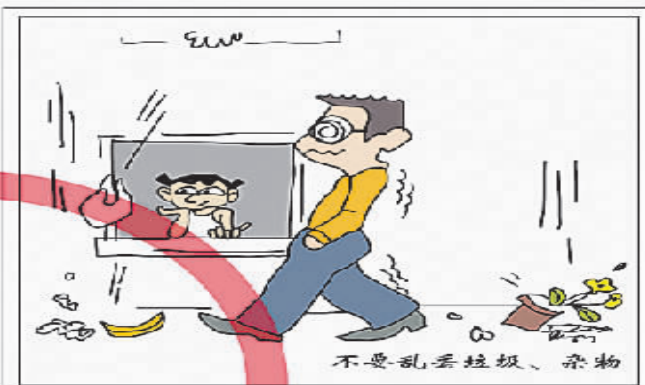
不要乱丢垃圾、杂物