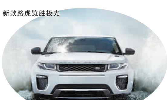
时尚先生的再次进化