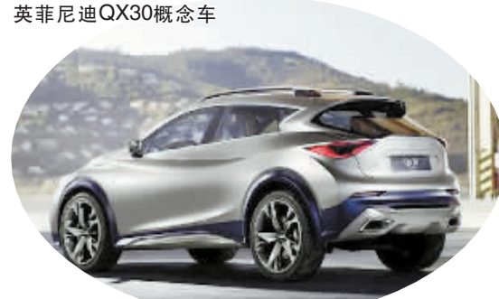
新车定位于豪华紧凑型SUV,量产版QX30将在2016年正式发布。