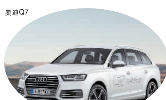
采用插电式混合动力系统