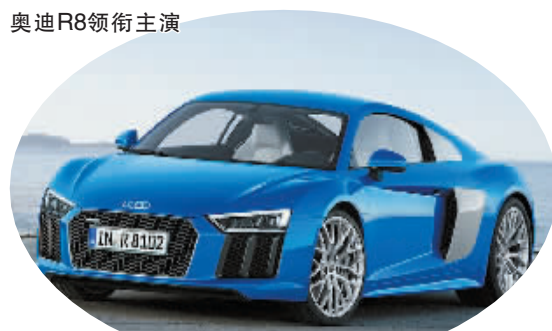
最大的看点或许只有那个需选装的激光大灯了