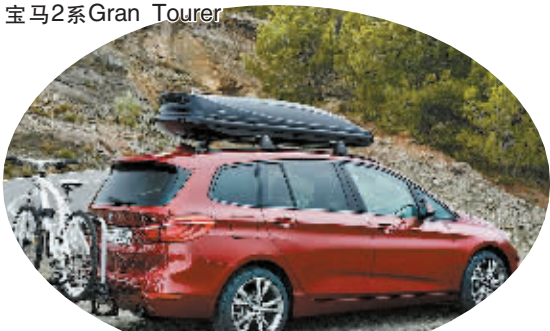
宝马的7座MPV,预计新车将在4月的上海车展亮相。