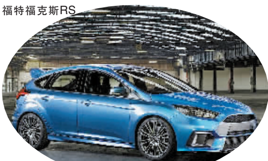
尽管北美车展跳了票,新款“小钢炮”能否成就高尔夫R的终结者?