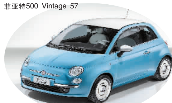
经典的复古元素,卖萌的蓝白涂装,让人爱不释手