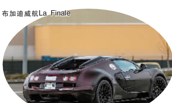
也许这是最后一台威航了