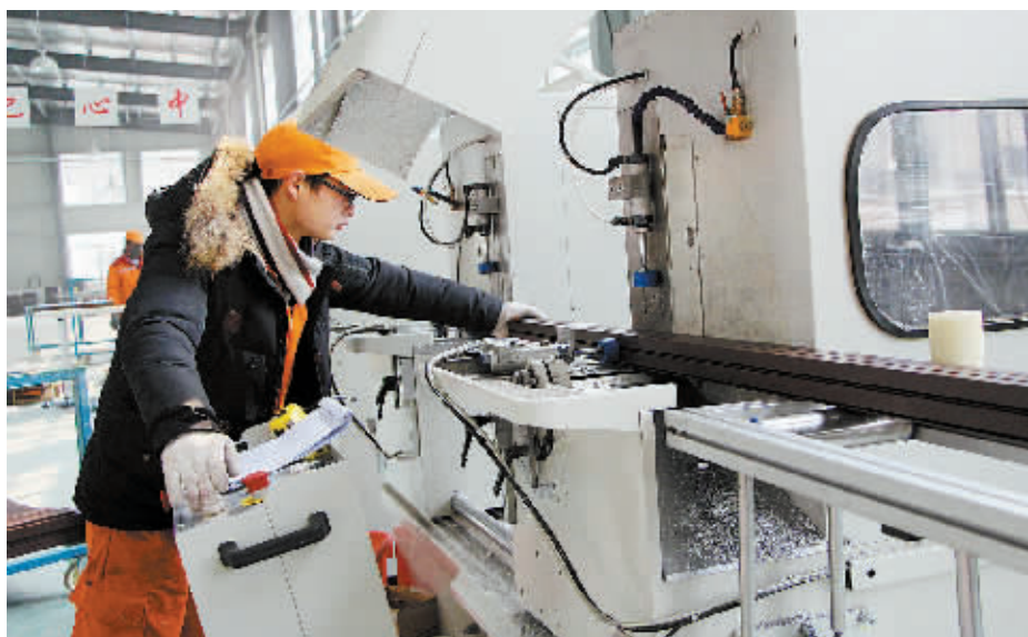
“天一美家家居文化创意产业园”项目位于信阳国际家居产业小镇北片区,占地面积约500亩,总建筑面积约40万平方米,总投资约12亿元。天一美家的门窗生产线已于2014年12月27日建成投产。图为天一美家的门窗生产线上,一名技术员正在操作铝门窗数控双头切割锯床切割铝材的情景。

《导则》还明确规定,建筑装饰设计单位为设计质量的第一责任人,由于设计原因造成的质量问题应由设计单位负责。