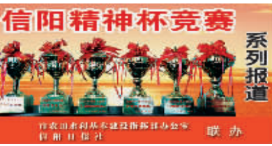
信阳精神杯竞赛系列报道

强化督导检查,确保工作实效。为确保农田水利基本建设取得实效,该区水利局及各乡镇有关部门逐步建立和完善农田水利基本建设绩效考核和奖惩制度。通过表扬先进、督促后进,该区农建工作越干越实,效果越来越好。同时,该区通过分区域、分工程、分项目进行督导,定期对政策引导、示范带动、资金投入、社会资金、互惠互利办水利等方面进行检查,以此推进全区农田水利基本建设扎实有效开展。