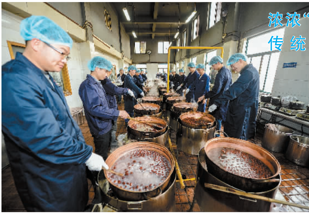
浓浓“腊八粥” 传统年味来

中央组织部要求各级组织部门把这项工作作为贯彻落实党的十八大、十八届三中、四中全会和习近平总书记系列重要讲话精神,巩固和拓展党的群众路线教育实践活动成果,增强党组织凝聚力和影响力的一项重要措施来抓,精心组织,抓好落实,并从代本级党委(工委)管理党费中配套相应额度用于开展走访慰问活动,确保专款专用、用出效益,让生活困难党员和老党员切实感受到党中央的关怀和温暖。