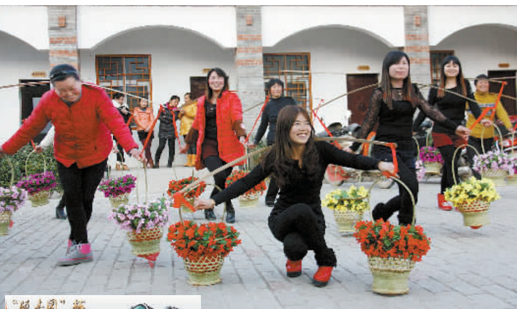
1月23日,为迎接农历羊年的到来,平桥区郝堂村的村民自发组织起来扎花篮、做旱船,排练节目,歌唱党的好政策。

大会审议并通过了信阳市总工会第二届委员会工作报告、财务工作报告和经费审查委员会工作报告;选举了信阳市总工会第三届委员会和经费审查委员会;提名产生了信阳市总工会第三届女职工委。