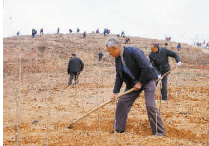
1月24日,光山县城信实业公司员工在种植基地里移栽苗木。该公司多年来流转荒山、荒地近万亩,种植茶叶、油茶、名优苗木花卉,发展茶叶基地500余亩,油茶基地4000余亩,苗木花卉基地2000余亩,实现生态效益和经济效益双丰收。

环发展的目标。资金投入多元化。该县积极争取项目资金,强力推进农村饮水安全、水库除险加固、水土保持综合治理等重点水利工程。同时各乡镇因地制宜,加大政府财政投入,广泛吸纳民间、民营及社会资金投入水利建设。汪桥镇政府拿出10万元农田水利基本建设奖励资金,对建设规模大、效益好的工程进行奖励。利用外出成功人士多的优势,动员其参与到水利建设中来,目前已完成25口大塘清淤整修及高标准配套建设工程,累计投入建设资金180万元,完成土石方4.2万立方米,还有近40口大塘整修工程和鲍楼灌区渠道整修工作正在紧张施工中。上石桥镇刘楼村外出成功人士个人捐资11万元用于大塘整修及附属设施建设;塘湾村合作社投资15万元整修大塘3口。河风桥乡政府投入4万元,对铁佛寺九斗渠进行整修,工程已完工。长竹园乡连续多年实施灌区汪冲段综合治理建设,今冬自筹资金45余万元,继续实施灌区汪冲段东岸、长竹园大桥下游河道治理109米,不断提高河道防洪标准。