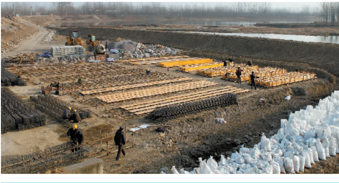
近日,我市各县区冬修水利建设呈现出一派热火朝天的场景,1月15日下午,记者在光山县陈兴寨看到劳动者在除险加固大坝。图为劳动场景。

“现在借据上的人物信息均可以对上,但借条的真伪以及相关信息的核实,还有待专家进一步查实。”市文物局相关负责人说。