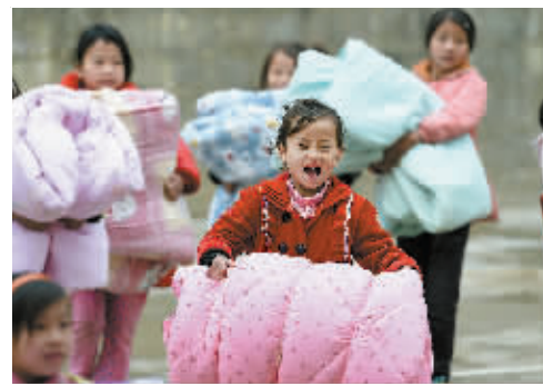
1月6日,广西大化瑶族自治县板升乡弄勇小学的同学们在领取爱心棉被。 当日,广西八个公益团体联合开展“‘被子’的爱”活动,志愿者们给广西大化瑶族自治县板升乡弄勇小学的255名孩子送来棉被等御寒物资,用爱心帮助山里娃温暖过冬。

责任,全力以赴抓好岁末年初安全生产工作。会议强调,2015年要进一步强化红线意识,完善落实“党政同责、一岗双责、齐抓共管”的安全生产责任体系。要深入宣传贯彻新《安全生产法》,加强安全监管执法力量,严肃事故查处和责任追究。要继续深化重点行业领域安全专项整治,抓好煤矿治理本攻坚和整顿关闭,打好油气输送管道隐患排查攻坚战。要夯实安全基础,继续开展企业标准化建设,强化安全生产大检查,深入推进打非治违专项行动,加强重点领域安全管理和风险防范,进一步强化春运组织、道路交通安全和消防安全管理,彻底排查安全隐患,强化应急准备,督促落实安全生产