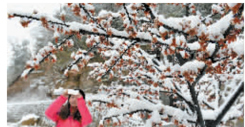
1月6日,游客在湖北省保康县马桥镇尧治河村拍摄雪景。当日,湖北省保康县迎来2015年首场降雪。 当日是二十四节气中的小寒,受冷空气影响,我国部分地区出现了大风降温或雨雪天气,寒意逼人。

新华社北京1月5日电(记者 刘羊旻)记者从5日召开的全国林业厅局长会上获悉,2015年国家拟安排退耕还林任务1000万亩,并启动严重沙化耕地和重要水源地坡耕地的退耕还林。 国家林业局副局长张建龙说,2015年,林业将重点通过生态红线、守生态红线,主动适应新常态,全力服务新常态。扩绿线,即全年力争完成造林9500万亩,突出抓好干旱半干旱地区造林,扩大天然林保护工程实施范围,新增湿地保护和退耕还湿面积,加大防沙治沙和自然保护区建设力度。 守红线,即强化依法治林,严守林地和森林、湿地、沙区植被、物种4条生态红线。严格林地保护管理,深入开展非法侵占林地清理排查专项行动,更新完善林地“一张图”,把林地和森林生态红线落到山头地块。严禁将湿地开垦成耕地,严禁在湿地公园、湿地保护区内搞商业性开发。