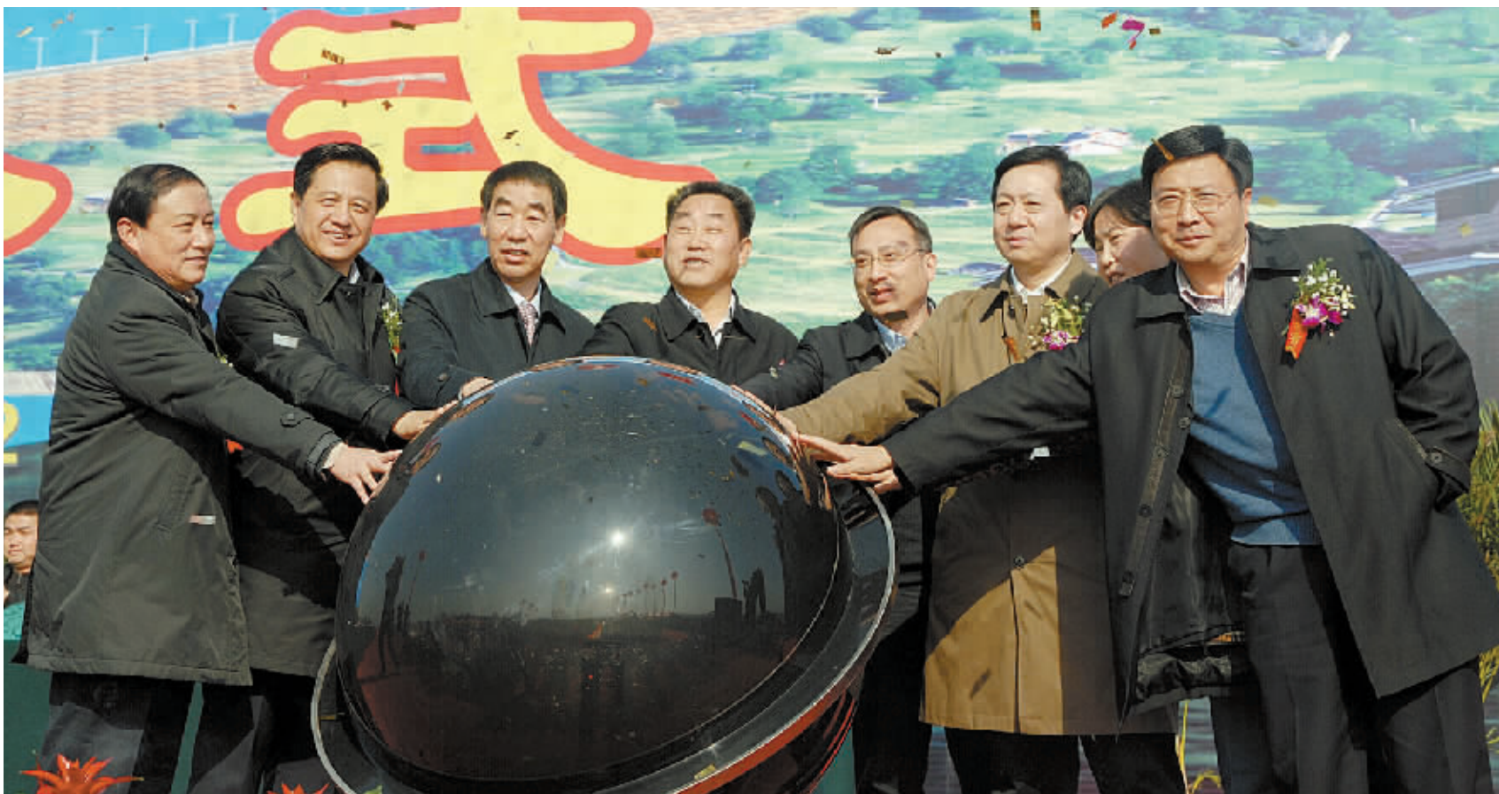
2011年12月12日,河南省出山店水库前期准备工程启动,省、市领导共同按动启动器。