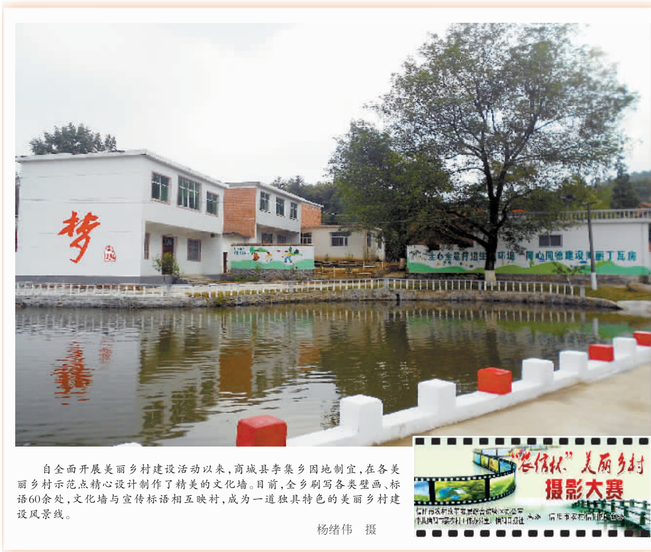
自全面开展美丽乡村建设活动以来,商城县李集乡因地制宜,在各美丽乡村示范点精心设计制作了精美的文化墙。目前,全乡刷写各类壁画、标语60余处,文化墙与宣传标语相互映衬,成为一道独具特色的美丽乡村建设风景线。

本报讯(王进履 冯振胜)近期,平桥区龙井乡扎实做好村级组织换届选举工作。该乡成立了选举工作领导小组和5个指导组,同时做到“四个摸清”,把问题消除在换届选举之前。截至目前,各村都进行了“两公布”,公布了各村财务收支情况和选举时间,为选举工作顺利进行奠定了基础。