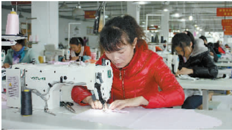
图为平桥区豪客礼服厂车间内员工忙碌工作的场景。

为了宣传平桥产业集聚区,及时填补企业用工缺口,平桥区多渠道发布了海量的招工信息,在弘运、信运汽车站设立工作站和大型宣传牌,到周