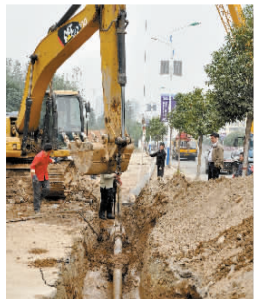
为了使河南岸、震雷山区域的居民能够尽早使用天然气,信阳富地燃气有限公司历经56天艰苦奋斗,穿越淮河定向钻燃气工程于日前圆满竣工。图为施工现场。

安全无小事。本报在此提醒广大市民,人人都应遵守交通规则,切勿横穿马路,千万不可为图一时方便,酿成终生遗憾。