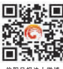
信阳日报微信公众账号