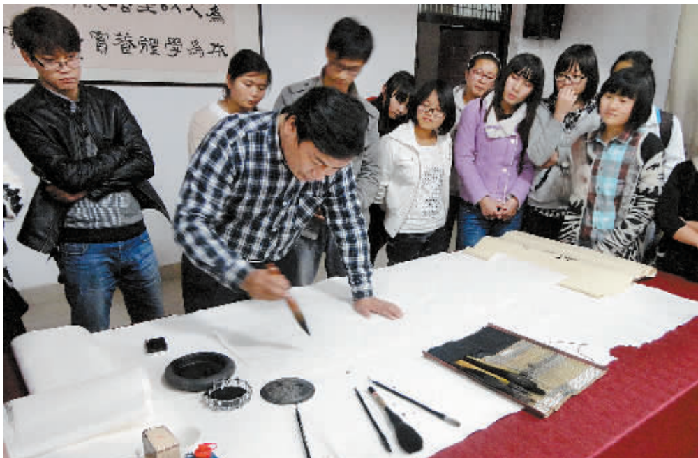
11月4日,信阳师范学院举办“书情画意,扬我中国梦”书法交流会。此次交流会丰富了全校学生的课余校园生活,陶冶了广大学生的艺术审美情操,引领学生树立正确的价值观和人生观,营造了浓厚的校园文化氛围。

该县以创建国家级文明县城、卫生县城为目标,按照城镇创“三优”的工作要求,将每年全县“双十工程”建设项目向城市建设倾斜,力争通过2年至3年的努力,使商城县60%的乡镇达到市级文明乡镇标准,30%的乡镇达到省级文明乡镇标准,90%的乡镇达到省、市级卫生乡镇标准,使县城逐步达到国家级文明、卫生县城的创建标准,让创建成果惠及全县更多群众。