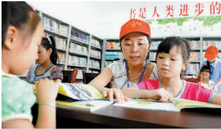
8月20日,在肥西县花岗镇贵阳社区,志愿者在陪伴留守儿童阅读课外书籍。

为丰富农村留守儿童的业余生活,安徽省肥西县花岗镇依托社区“幸福生活站”,通过组织志愿者开设手工制作、快乐书屋、亲情视频等,为农村留守儿童提供安全舒适的学习、休闲、娱乐空间。