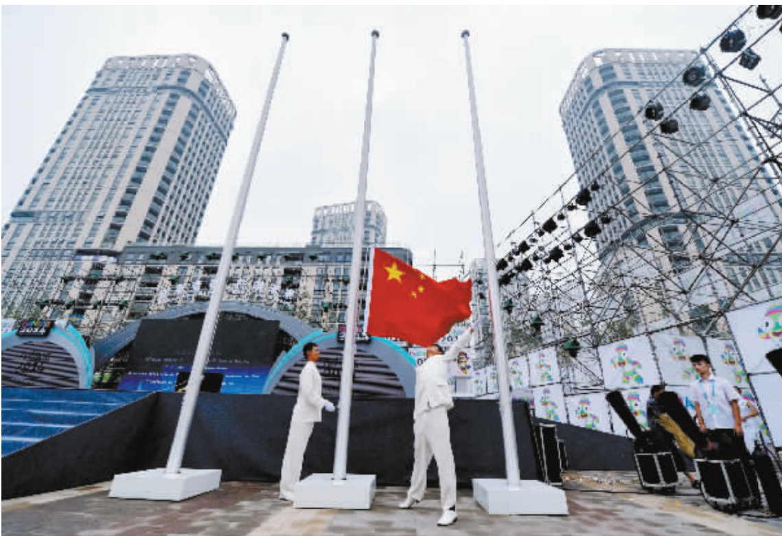
8月12日,开村仪式上举行升中国国旗仪式。当日,2014南京青奥会青奥村正式开村。青奥村位于南京市河西新城滨江沿岸,占地约14万平方米,总建筑面积约50万平方米,总共有6幢居住楼和4幢配套建筑,将为约6000名运动员、随队官员、青年记者等提供住宿、餐饮和其他服务。

新华社北京8月12日电 民政部网站12日发布消息称,全国双拥工作领导小组近日发出通知,从今年8月至明年底在全国范围内部署开展“双拥在基层”活动。 通知要求,各地各部队各部门要着眼夯实军民团结的社会基础和群众基础,坚持双拥工作任务从基层抓起,政策法规在基层落实,发展成果向基层惠及,推动解决涉及部队官兵和广大优抚对象的切身利益问题,在全社会倡导形成爱国拥军、爱民奉献的良好风尚,凝聚实现中国梦和强军目标的强大力量。 通知指出,活动要紧贴基层双拥工作具体实践,紧贴地方经济社会发展和基层部队建设需要,紧贴部队官兵和优抚安置对象期盼,综合施策,统筹推进,重点做好加强热爱国防崇尚荣誉宣传教育、帮助基层部队排忧解难、解决优抚安置对象特殊困难、开展爱民惠民助民活动四个方面的工作,推动双拥工作在基层有效落实。