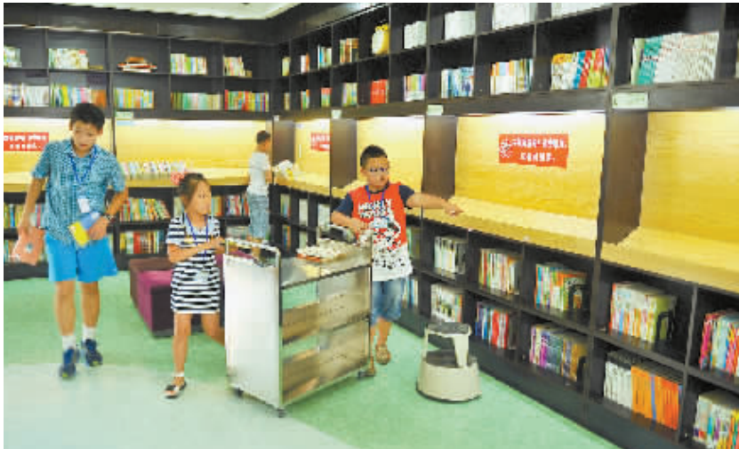
暑假期间,吉林省长春市图书馆开展“义务小馆员”实践活动,40名“义务小馆员”经工作人员培训后“上岗”,负责帮助读者借书还书、整理图书文献等。

自治区纪委通报称,经查,2013年6月至12月,广西来宾市政协违反中央八项规定精神,先后组织由政协副主席带队的8个课题调研组11批次赴外省调研,其中10批次与旅行社签订旅游合同,各组均不同程度存在超调研内容和行程到景区景点旅游,或以调研为名变相公款旅游等问题,构成挥霍浪费错误。在中央和自治区党委作出改进作风的多项规定后,还发生参与人数多、涉及多名厅级领导干部的变相公款旅游问题,性质严重,影响恶劣,自治区党委、自治区纪委高度重视,立即进行严肃查处。