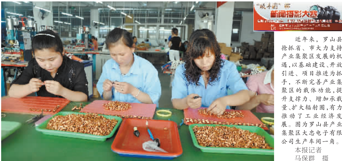
近年来,罗山县抢抓省、市大力支持产业集聚区发展的机遇,以基础设施建设、开放引进、项目推进为抓手,不断完善产业集聚区的载体功能,提升支撑力、增加承载力、扩大辐射面,有力推动了工业经济发展。图为罗山县产业集聚区大忠电子有限公司生产车间一角。

军属优抚条例》等涉军法律法规和与群众生产生活相关的法规,让群众在家门口学习法律知识,解决法律疑惑,提高法律素养,达到服务群众、弘扬法治的目的,受到广大干群的欢迎和好评。首场活动当天,现场参与律师、公证员、司法行政工作人员60多人,设咨询台8个,挂宣传标语6条,摆宣传展板8块,解答群众法律咨询100多人次,散发宣传材料2000份。