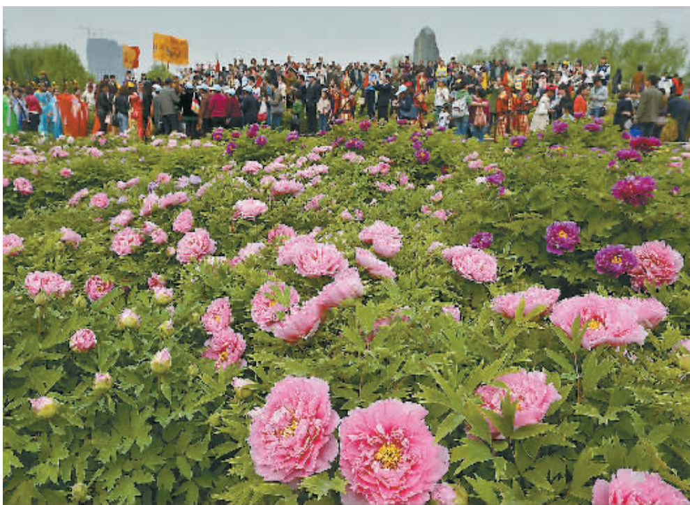
游客们在河南省洛阳市隋唐遗址植物园的牡丹园内赏花、游玩(2014年4月13日摄)。据中国旅游研究院近日发布的《2014年上半年旅游经济运行分析与下半年趋势预测报告》,2014年上半年,我国旅游经济运行总体良好,国民旅游消费的基础性需求依然保持两位数的高速增长。预计上半年国内旅游人数18.5亿人次,同比增长10.2%,国内旅游收入1.5万亿元,同比增长16%。

地方真正去采纳实施。如今,河南新县采取在公车车身喷涂“公务用车”的字样,并公布监督电话,顺应了群众监督公车私用的热情。也要看到,在喷涂了便于群众监督的字样、公布了举报监督电话之后,还要切实保证路线畅通,并让举报线索得到及时的核实和反馈。唯有如此,群众的监督热情才能得到维护,“微改革”才能取得实效。(新华社郑州8月1日电)