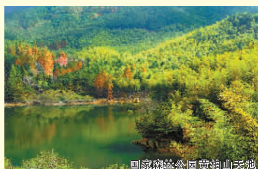
国家森林公园黄柏山天地