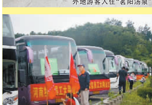
700人的旅游大巴开进商城县