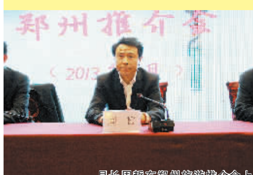
县长周哲在郑州旅游推介会上