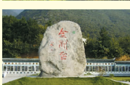
国家地质公园金刚台