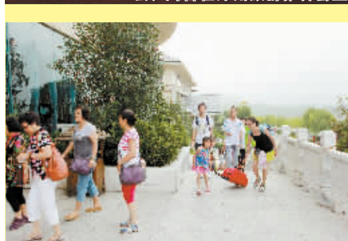
外地游客入住“茗阳汤泉”