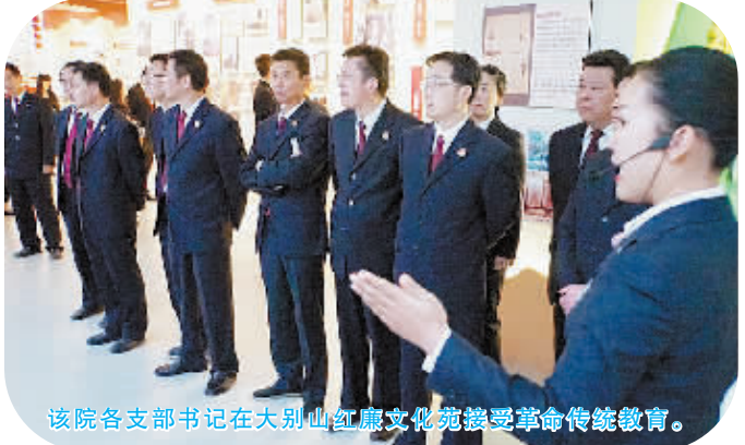
该院各支部书记在大别山红廉文化展览馆接受革命传统教育。