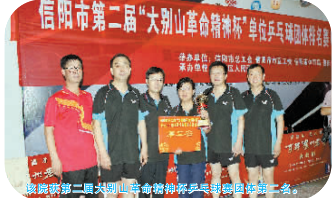
该院获第二届大别山革命精神杯乒乓球赛团体第二名。