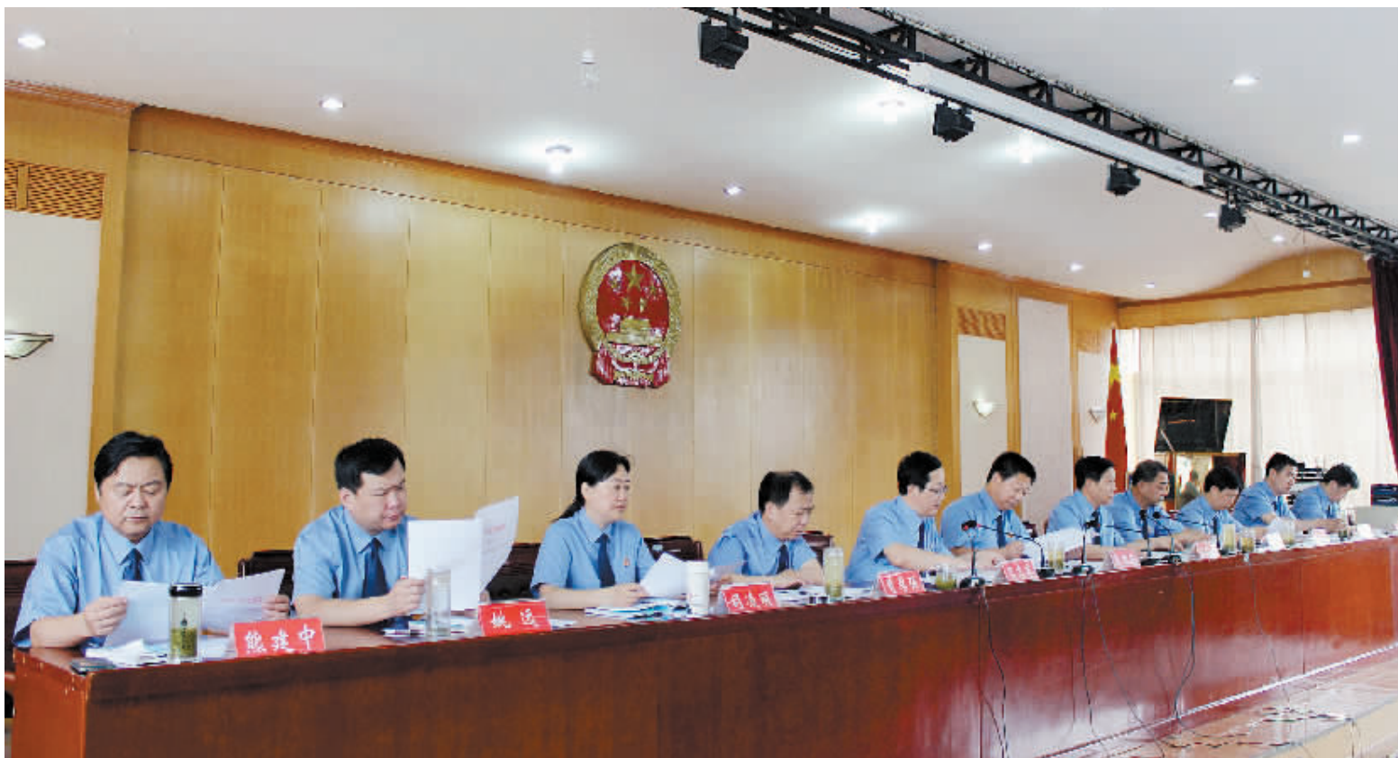
7月14日,郭国谦(左六)在全市检察机关半年工作会议上作重要讲话。