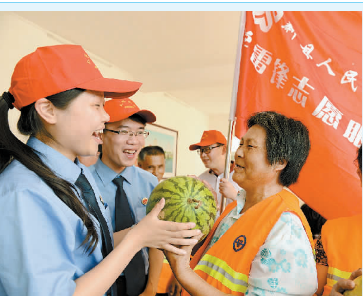
近日,新县检察院学雷锋青年志愿者服务队来到新县环卫工人爱心食堂,送去西瓜、肉、鸡蛋等慰问品。志愿者们还与环卫工人拉家常,了解他们的生活情况,以实际行动表达对在高温下坚持露天工作的环卫工人的敬意和感谢。

光山县法院审理认为,被告人谢某以牟利为目的,违反土地管理法规,非法转让65亩土地使用权,非法获利150万元,情节严重,其行为已构成非法转让土地使用权罪,遂作出上述判决。