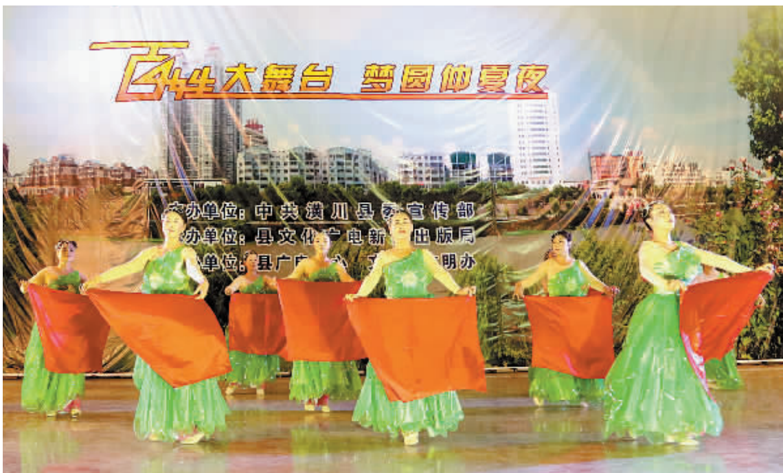
为了丰富群众文化生活,为广大文艺爱好者搭建展示才艺的平台,7月6日,潢川县在县委会展中心举办了“水城花乡·大众欢乐”系列广场文化活动,百余名文艺爱好者以舞蹈、京剧、太极等多种艺术形式,为现场数千名观众献上了一场视觉盛宴。