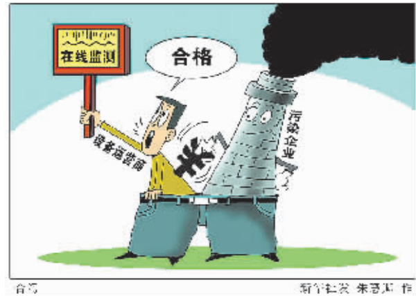
□新华社记者 张涛 刘宝森 马殊瑞 杨丁森 赵倩

据环保部统计,为加大对企业环保措施的监管,目前由中央和地方配套投入污染源在线监测网络的资金已逾百亿元,能够监控上万个污染源。