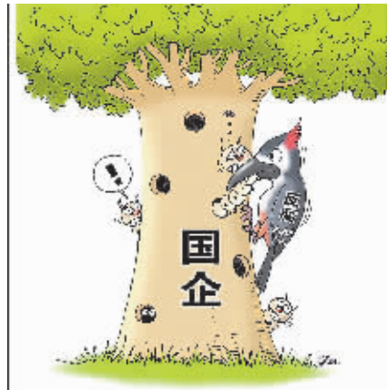
□新华社记者 何宗渝 刘敏 杨玉华 张丽娜 梁晓飞