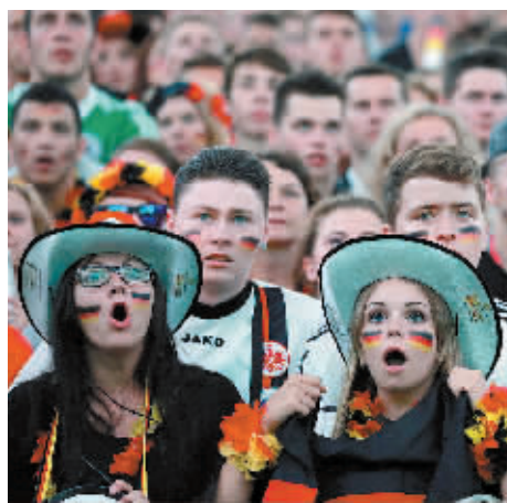
6月21日,球迷在观看比赛。

小组遭淘汰。G组首轮4:0大胜葡萄牙队的德国队当天遭遇到加纳队顽强阻击,险些被对手爆冷拿下。上半场双方均未能破门,德国队杰·博阿滕和加纳队凯·博阿滕两兄弟同时首发,但表现平平,下半场均被各自主教练替换下场。