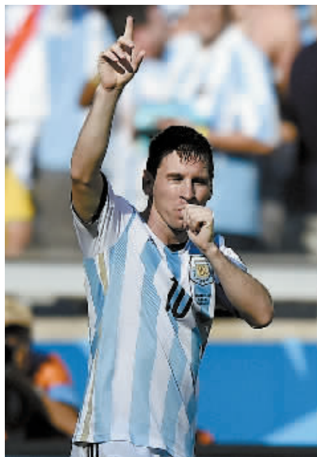
6月21日,阿根廷队球员梅西庆祝进球。