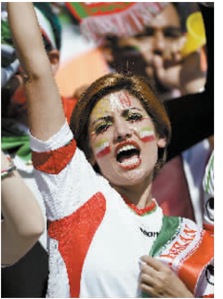
6月21日,伊朗队球迷赛前为球队加油助威。