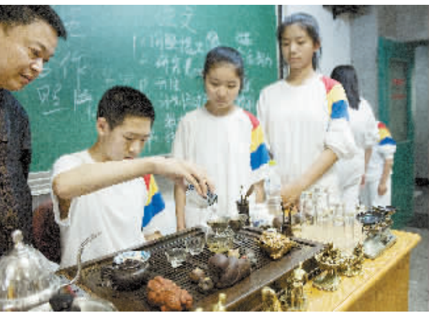
6月21日,一位学生在老师的指导下进行茶艺展示。当日,北京市东城区第二十五中学举办青少年茶文化与健康论坛,并在学校设立的茶艺室中进行茶艺展示活动。