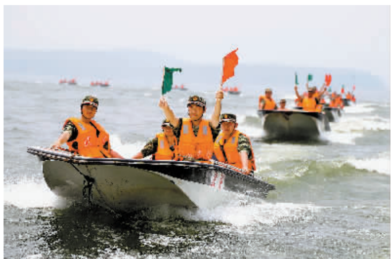
6月18日,武警官兵驾驶冲锋舟在进行水中编队演练。当日,武警河南总队直属支队“方舟-14”艇编综合演练在某水上训练基地展开,此次演练围绕冲锋舟驾驶操作、旗语指挥、水中编队以及复杂水况下的打捞、救护、转移等课目进行。

门备案,由省级人民代表大会或其常委会修订地方性法规或作出规定,依法组织实施。《全国人大常委会关于调整完善生育政策的决议》也明确提出,各省、自治区、直辖市人民代表大会或者其常务委员会应当根据人口和计划生育法和本决议,结合本地实际情况,及时修改相关地方性法规或者作出规定。单独两孩政策由各省(区、市)依法启动实施。