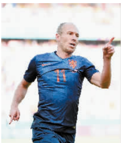
6月18日,荷兰队球员罗本庆祝进球。