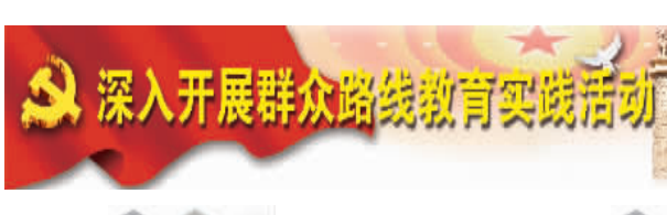
深入开展群众路线教育实践活动

本报讯(苏良博 谢霄霞)连日来, 光山县各部门全力为高考保驾护航, 取得良好成效。 该县一是启动“高考保供电”应急预案, 提前对城区5个高考考点的用电设备及输电线路进行安全巡查, 并增加特巡频率。二是禁噪保洁, 净化环境。三是保证道路畅通, 加强护送引导。在高考考点必经路段规范交通标识, 安排警力在考点周边24小时巡逻, 疏通道路, 营造良好的交通安全环境。 责编:徐立明 审读:刘翔 组版:孟琳