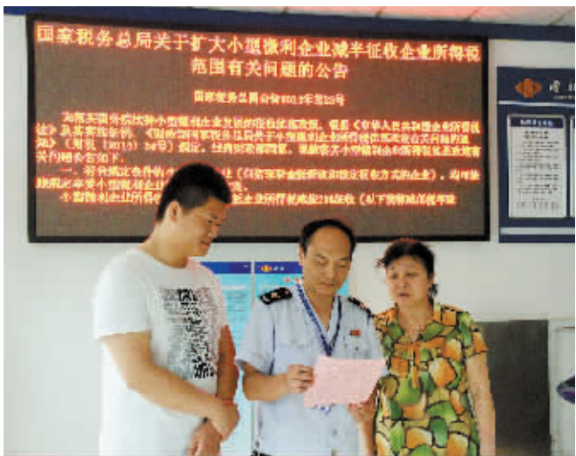
图为日前该局工作人员正在为纳税人讲解小微企业税收优惠政策。

三是抓好抵缴调整,保障政策落实到位。由于新的小微企业优惠政策发布较晚,该局对于按月申报的纳税人,安排办税服务厅进行减免税申报测试,实施税收抵缴;对于按季申报的纳税人,积极做好准备,等待省局综合征管软件升级后,对纳税人已经征收的第一季度税款从第二季度申报税款中进行抵缴;对于核定征收的纳税人,严格按照程序,及时进行税款核定调整,确保优惠政策落实到位。