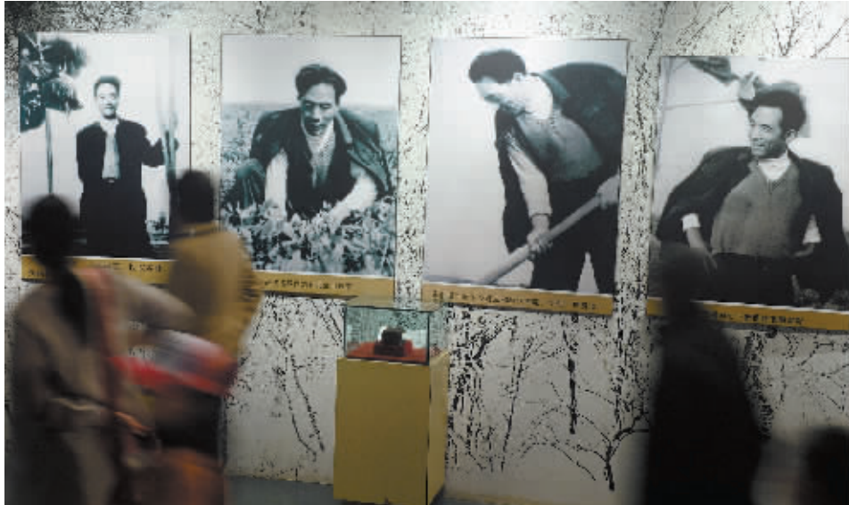
人们在兰考焦裕禄纪念馆内参观原兰考县委书记刘俊生拍摄的4张焦裕禄照片。