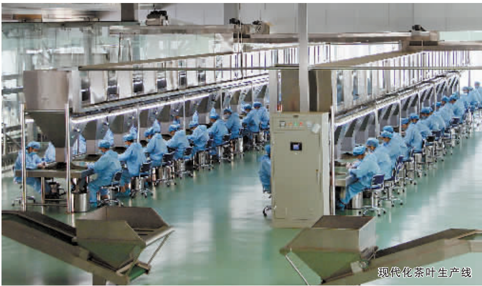
现代化茶叶生产线

目前,全区红茶年产量已达520万公斤,成为名副其实的全国新兴红茶第一大产区,经济效益明显增强,沙河港、董家河、谭家河等重点产茶乡镇茶农人均茶叶增收达到2600元以上,茶乡百姓的日子过得一天比一天红火。