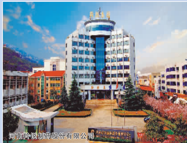
河南羚锐制药股份有限公司