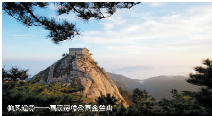
仙风道骨——国家森林公园金兰山