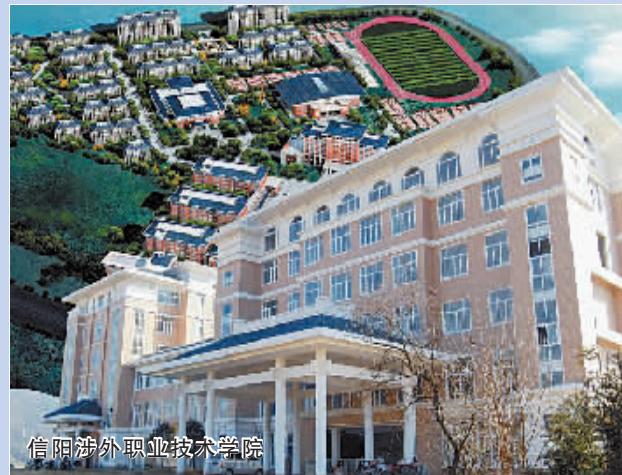
信阳涉外职业技术学院