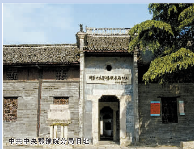
中共中央鄂豫皖分局旧址