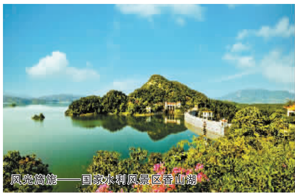
风光旖旎——国家水利风景区香山湖

新县突出医药制造、农副产品加工和电子信息为主的健康产业,积极推进羚锐健康产业园、九龙岭食品工业园、兰河电子科技园建设,培育了鄂豫皖革命老区第一家上市企业羚锐公司;坚持职业教育与涉外劳务相结合,建成河南省首家高等涉外院校——信阳涉外职业技术学院,成功探索“职业培训+国外就业+返乡创业”职教新模式,全县常年在国外务工人员保持在6000人左右,年创外汇8841万美元;建成大别山干部学院、河南省检察院大别山分院和河南省检察博物馆,教育培训产业蓬勃兴起;抢抓机遇,在河南省文化改革发展试验区和农村改革发展综合试验区建设中,大胆探索,先行先试,改革风生水起,发展春潮澎湃;坚持“旅游兴县”,打造红色历史、绿色生态、古色乡村旅游精品线路,旅游经济日趋红火,2013年接待游客201.6万人次,实现综合收入9.07亿多元。